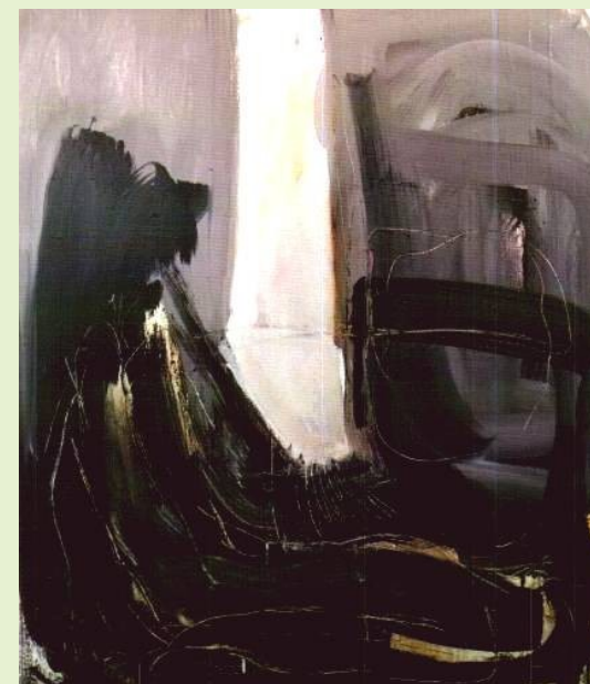
Job, 1995, akryl, plátno, 225 x 190 cm