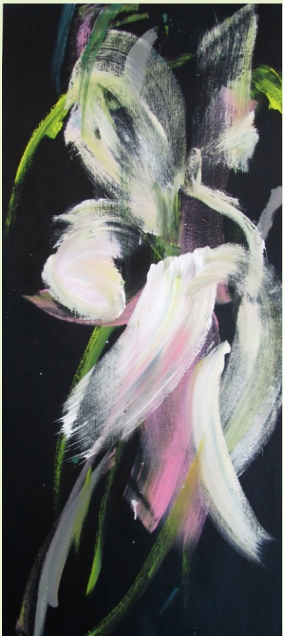
Jabloňový květ, 2011, akryl, plátno, 160 x 70 cm