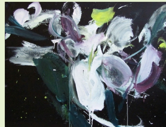
Jabloňové květy, 2011, akryl, plátno, 100 x 130 cm