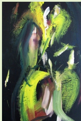
Lilie polní, 2011, akryl, plátno, 90 x 60 cm