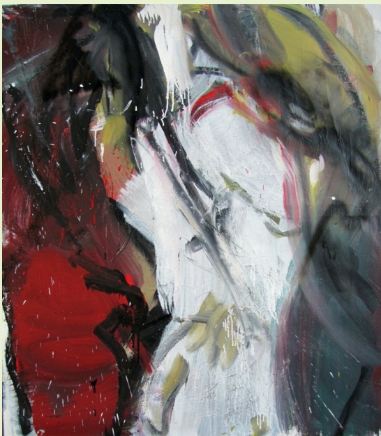
Blížkost, 2011, akryl, plátno, 150 x 130 cm