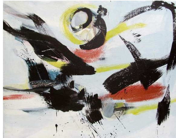
Obzor, 2007, akryl, plátno, 150 x 200 cm