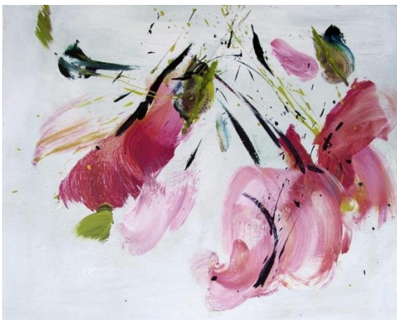
Na jaře, 2013, akryl, plátno, 80 x 100 cm