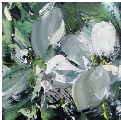
Třešňové květy, 2013, akryl, plátno, 40 x 40 cm