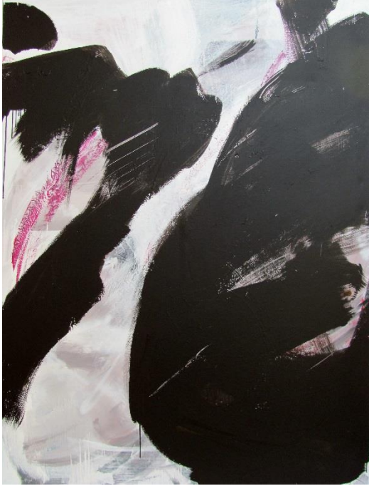
Otroci, 2008, akryl, plátno, 210 x 160 cm